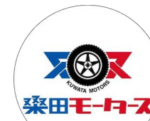
桑田モータース様 岡山県・指定工場

CarRideは、私が入り出している認証工場や、月間車検台数100台以上の指定工場でも大活躍しています。