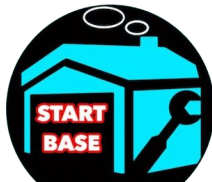
スタートベース様 長崎県・フリーランス

新規に開業された方だけでなく、整備ソフトを見直したい方にもおすすめできます。無料トライアルがあるので、まずはご自身で体験していただければと思います。