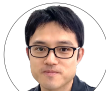
森本モータース様 三重県・認証工場